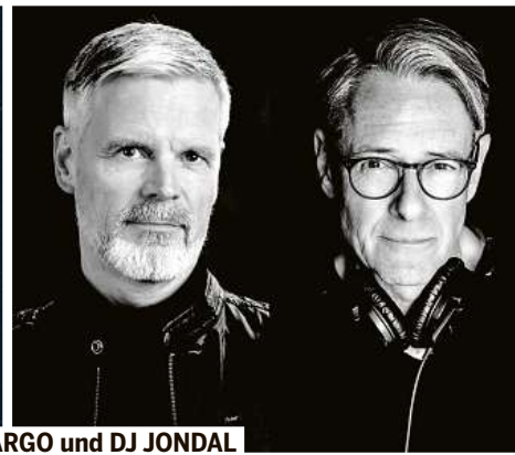
VARGO und DJ JONDAL

► Tickets und das komplette Programm: www.planetarium-hamburg.de/de/last-nights-of-the-stars